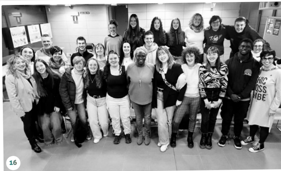
Charla de sensibilización en Salinas de Pamplona (Navarra).