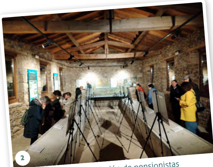
2 Colaboración con Asociación de pensionistas de Monreal y el Ayuntamiento del municipio mediante la exposición Flores de Bissau y charla de sensibilización.