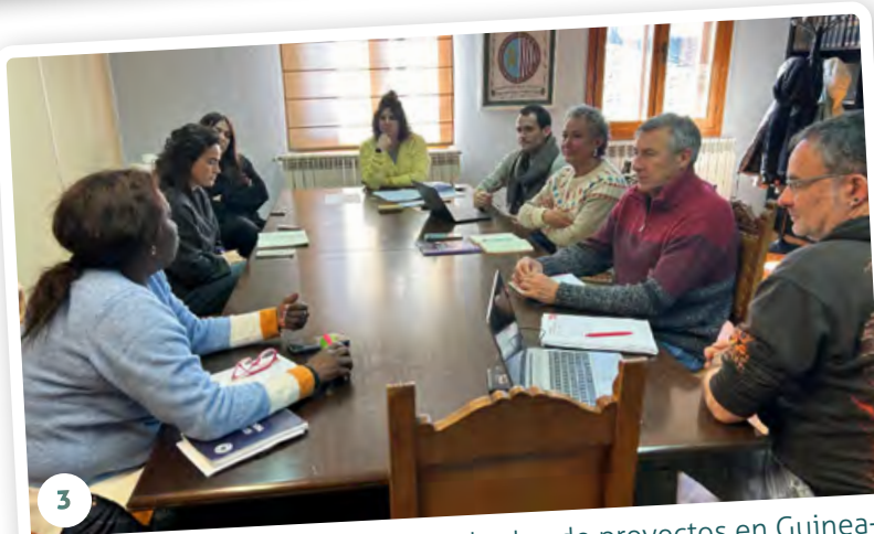
3 Reunión de socialización de resultados de proyectos en Guinea-Bissau junto al equipo de Gobierno municipal del Sangüesa, a modo de cierre de la colaboración iniciada junto a este Ayuntamiento desde el año 2024.